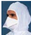
KIMTECH PURE* M3 袋状面罩