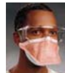
KIMTECH SCIENCE* FLUIDSHIELD* PFR5* N95呼吸罩及外科面罩