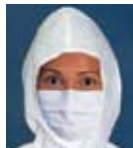
KIMTECH PURE* M3 面罩