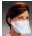
KIMTECH SCIENCE* PFR95* N95呼吸罩及外科面罩